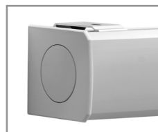
Aluminiumkassette aluminium natur-eloxiert