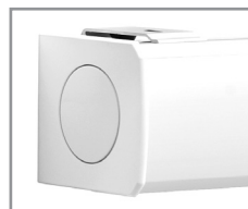
Aluminiumkassette weiß beschichtet (Standard)